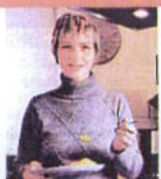
4 PFUND WEG!